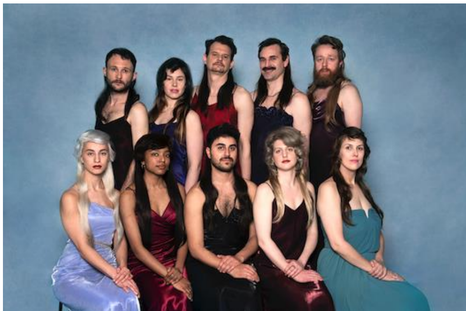
Drei, vier, flirt mit mir